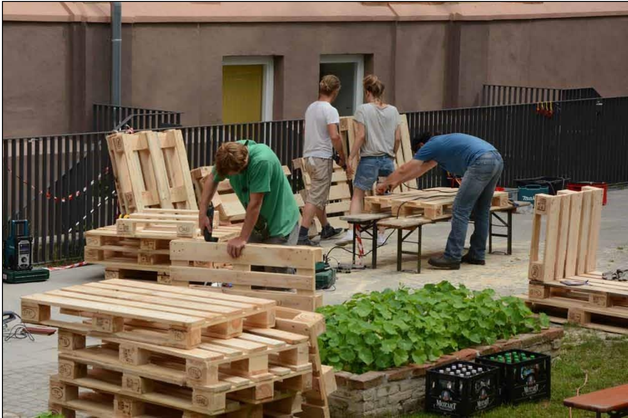
8.4.2 Elternarbeit im Rahmen von Elternabenden und pädagogischen Veranstaltungen

Um Erziehungspartnerschaft zu leben, finden jährlich 3 Elternabende statt. Neben der Begegnungsmöglichkeit werden aktuelle, organisatorische und vor allem pädagogische Themen aufgegriffen. Diese orientieren sich an der individuellen Gruppensituation, den Fragen der Eltern und der Montessori-Pädagogik. Eine regelmäßige Teilnahme ist Voraussetzung, um die Bildungsprozesse des/der Kindes/er, sowie Handlungsweisen des pädagogischen Teams nachvollziehen und verstehen zu können. Weitere pädagogische Veranstaltungen stellen Bausteine der Elternarbeit in unserem Haus dar und bereichern die Partnerschaft zwischen Eltern und Kinderhaus. Beispielsweise die Informationsveranstaltungen anlässlich des Tages der offenen Tür, oder die Informationsabende für Eltern zur vorschulischen Erziehung und dem Übertritt in die Grundschule.